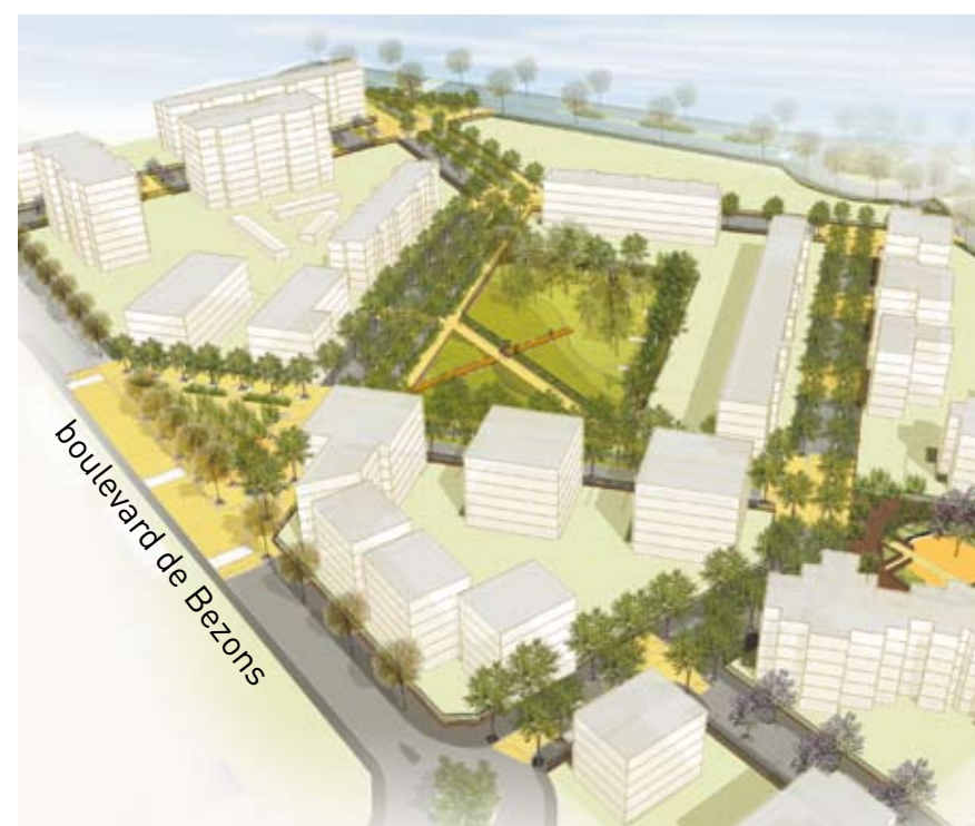
Doc D.R. non contractuel

La Ville a programmé dès 2010 la création de voies conçues pour mieux protéger les piétons et les cyclistes et d'un jardin public, ainsi que la modification et la sécurisation du carrefour du Grand V (Robert-Schuman/Général-de-Gaulle). Seront construits également une nouvelle halte-garderie, un second Relais Assistantes Maternelles ainsi que des salles dédiées aux activités associatives dont celles d'Atrium.