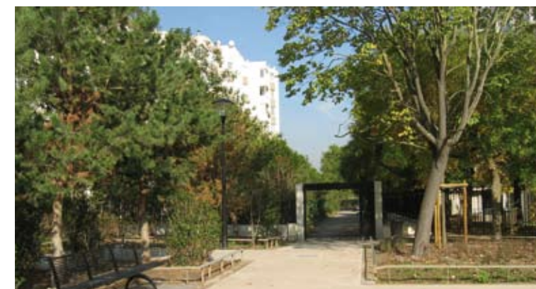
La partie ouest de la promenade déjà rénovée

l'avenue de l'Europe (photo de gauche), en faisant la part belle aux espaces verts. De part et d'autre de la Promenade, les programmes de réhabilitation et de résidentialisation ont concerné l'ensemble des résidences Osica, Logirep, Toit et Joie, Pierres et Lumières ainsi que les copropriétés privées grâce à des financements municipaux.