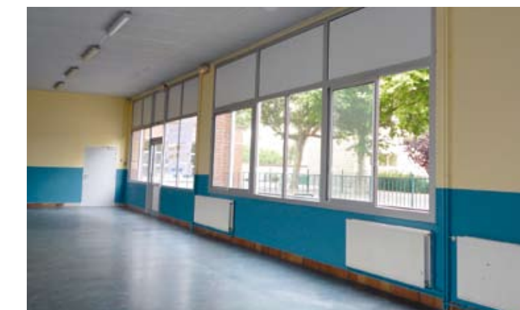
Préau renové de l'école Paul-Bert