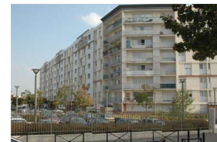
Logement Francilien, 2 rue du Berry

Le bailleur social Logement Francilien a réalisé la réhabilitation de la résidence du 2 rue du Berry, sa résidentialisation et l'aménagement de son parking. La Ville a modernisé l'ensemble du réseau d'éclairage public et a procédé à une rénovation d'envergure sur le groupe scolaire Paul-Bert/Georges-Brassens et le Complexe sportif Romain-Rolland.