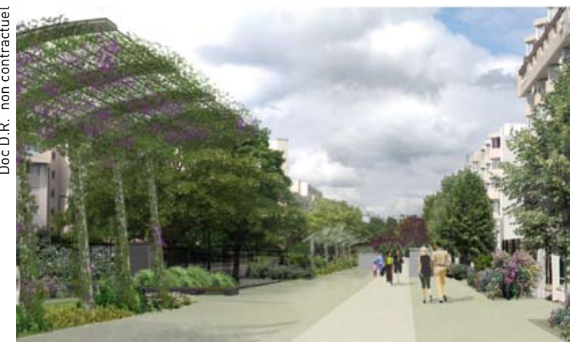
Doc D.R. non contractuel

Dans le même esprit, cet aménagement sera finalisé en 2010 sur la partie est, de la rue de Saint-Exupéry à