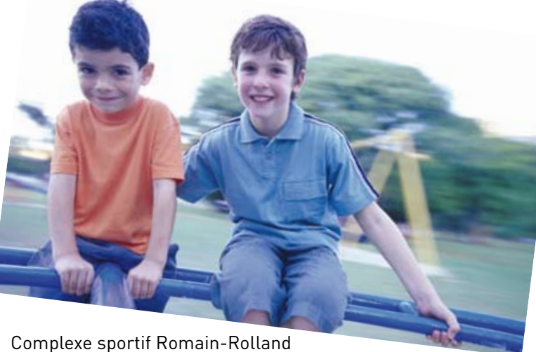
Complexe sportif Romain-Rolland