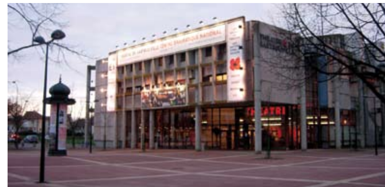
Une salle supplémentaire pour le Théâtre