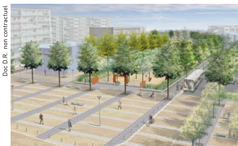
Doc D.R. non contractuel

Logement Francilien poursuivra son programme de rénovations et de résidentialisations tel que prévu dans la convention avec l'ANRU.