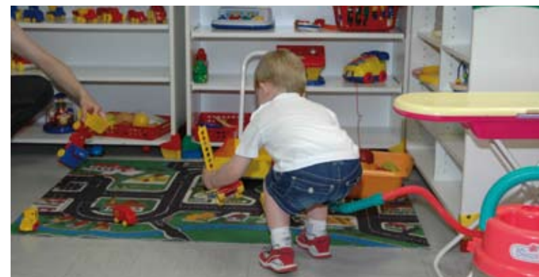
Une nouvelle halte-garderie et un Relais Assistantes Maternelles