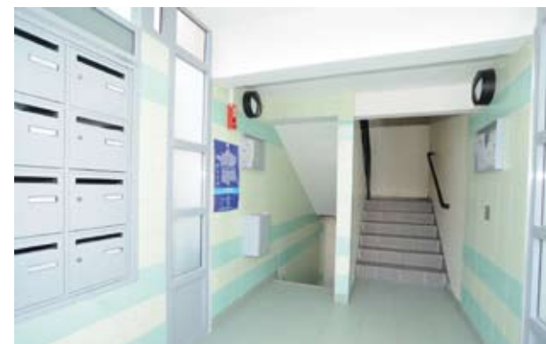
Un hall rénové

L'ensemble du projet de restructuration du quartier nécessitera la démolition de 232 logements vétustes, soit 20% du parc et 7 barres d'immeuble. Ces démolitions permettront la reconstruction de 172 logements neufs dans le quartier et 60 logements à l'extérieur du quartier.