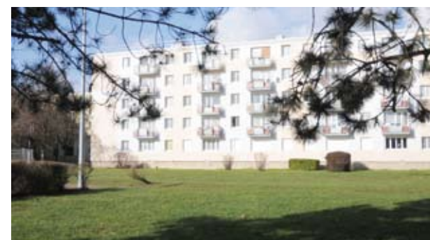
Un bâtiment réhabilité